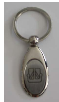
Porte-clef Métal siglé Dufour Yachts