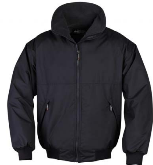
MJ1107 SNUG blouson Navy blue / Red / Black / White / Dune Taille : XS / S / M / L / XL / XXL