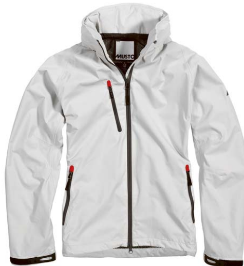
SB010W0 Sardinia Jacket Woman Color : Platinum / Navy / Black / Aqua Size : 36 / 38 / 40 / 42 / 44 / 46