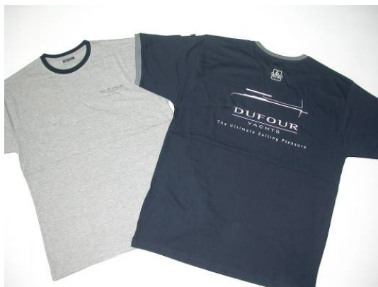
Tee-shirt 250g siglé Dufour Yachts Composition: 100% coton Couleur: Gris / Bleu Marine Size: S / M / L / XL / XXL