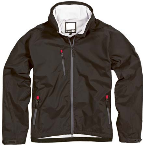
SB0100 Blouson Sardinia Homme Couleur : Platinum / Bleu Marine / Noir / Rouge Taille : XS / S / M / L / XL / XXL