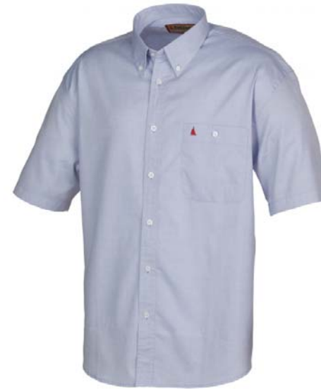
MW0273 Chemise OXFORD manches courtes Homme 100% coton Blanc / Chambray / Marine Taille : S / M / L / XL / XXL

A light and sporty jacket with a hood that tucks into the collar and with double lining.