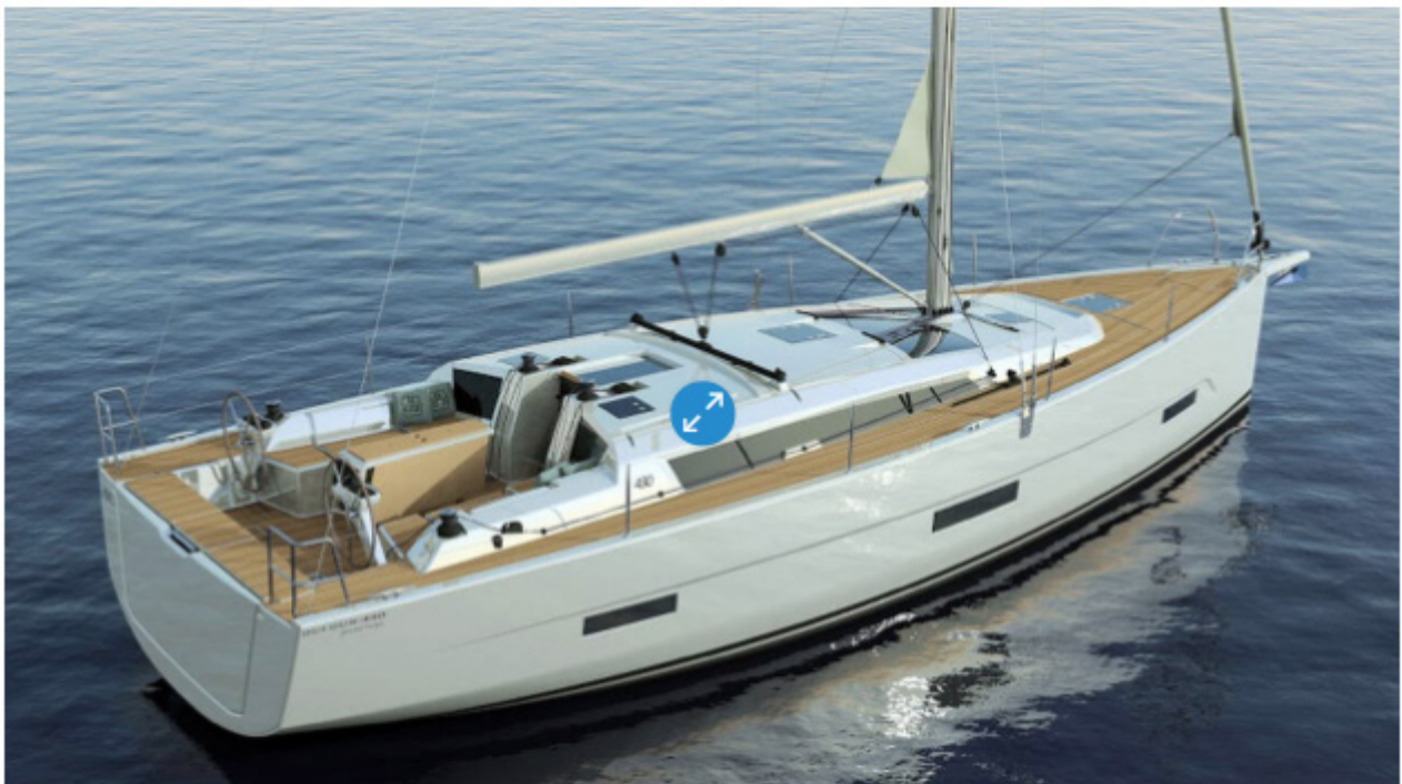
Le Dufour 430 GL en 3D.

La prochaine génération de la gamme croisière Dufour est annoncée, avec la présentation des Dufour 390 et 430 Grand Large attendue pour les salons de la rentrée, à Cannes et à La Rochelle.