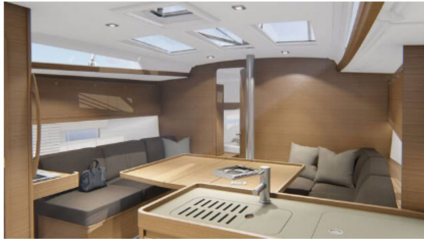
Dufour 390 GL : le carré.

Sur le Dufour 390 GL , la signature d'Umberto Felci se distingue par l'intégration des pavois, ainsi que par l'insert de bordé.