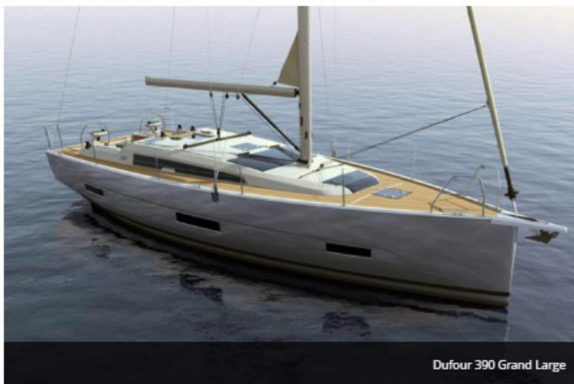
Dufour 390 Grand Large

En annonçant 3 nouveaux modèles, le chantier rochelais Dufour montre sa volonté de garder sa place parmi les grands constructeurs. Le 390 Grand Large est le premier à se dévoiler, un voilier de 11,93 m exactement dans le cœur de marché des monocoques.