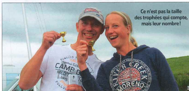
Ce n'est pas la taille des trophées qui compte, mais leur nombre!

Après le Morbihan Challenge, les amateurs de raid amical et d'aventures côtières pourront prendre la route nord pour participer au « Raid Extreme » sur le lac de Lauwersmeer, aux Pays-Bas. Ce n'est pas tant le parcours d'une quarantaine de milles qui est extrême, mais les options de navigation. On s'explique. Les organisateurs déposent cinq boîtes, à cinq endroits différents du lac, dans lesquelles ils introduisent un carnet et un petit trophée. Après avoir émarginé le cahier et emporté le trophée, il faut réitérer l'opération aux quatre autres endroits. Pour gagner, il faut récolter tous les petits trophées, donc arriver premier à chaque checkpoint... Et pour compliquer la tâche, le lac Lauwersmeer est, comme tout plan d'eau fermé, doté d'une micro-météo locale, avec des vents qui tournent, des petits courants qui contrarient les plans de navigation. Tout un programme! Tous types d'embarcations sont les bienvenus sur la ligne de départ, voile-aviron, paddle, catas de sport, dériveurs et petits voiliers... Le raid se déroulera le 1 er septembre, rendez-vous la veille pour jauger la concurrence. Plus d'infos en ligne : raidextreme.wixsite.com