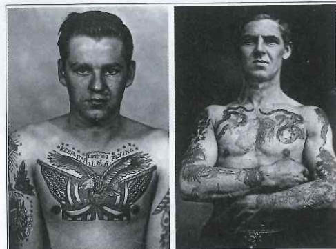
▲ Les corps des marins étaient un laboratoire pour les premiers tatoueurs.