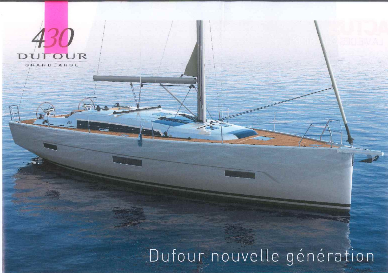
Dufour nouvelle génération

hommes – et, bizarrement, le bateau avance plus que bien. Comme quoi. Si vous aussi vous voulez participer à cette aventure humaine et maritime, si vous avez du temps pour tordre le cou aux préjugés et naviguer, postulez pour la navigation. La session de recrutement se déroule chaque année vers octobre. Plus d'information en ligne : www.teamjolokia.com