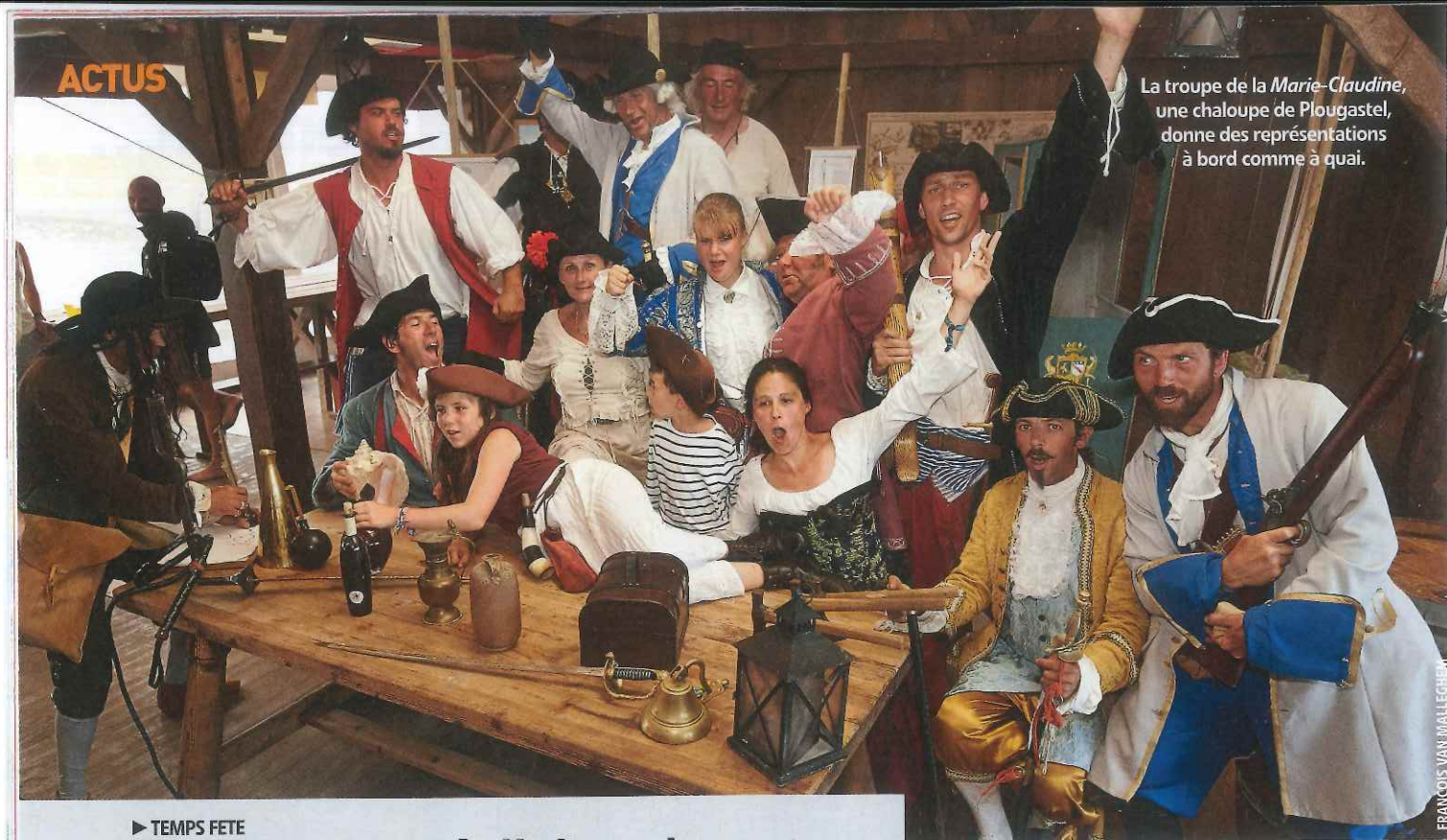
La troupe de la Marie-Claudine , une chaloupe de Plougastel, donne des représentations à bord comme à quai.