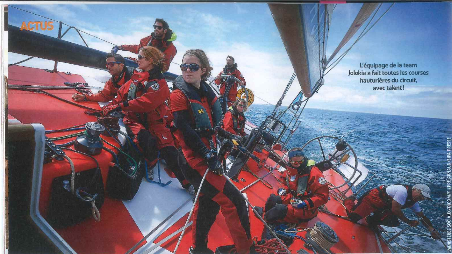
L'équipage de la team Jolokia a fait toutes les courses hauturières du circuit, avec talent!