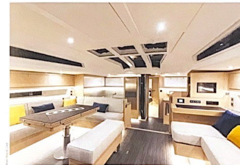
LE SALON DU DUFOUR 61 EST TRÈS SPACIEUX ET LA CUISINE, DANS LA LARGEUR AGRANDIT ENCORE L'ESPACE DE VIE NEURALGIQUE. UNE CUISINE EN COURSIVE EST AUSSI DISPONIBLE POUR PRÉSERVER L'INTIMITÉ DES CONVIVÉS ET DE L'ÉQUIPAGE.