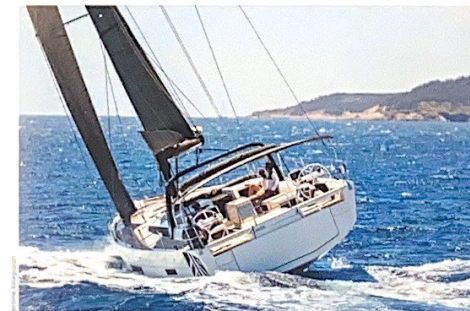
LE PLAISIR DE NAVIGATION PASSE PAR DE BONNES SENSATIONS DE BARRE. L'ÉQUILIBRE DE LA CARÈNE EST ICI IDÉAL ET DONNE LE SOURIRE AU BARREUR.