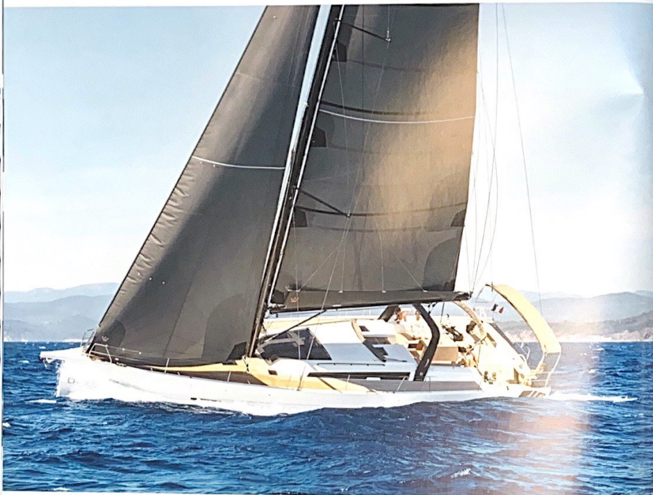
LA LIGNE TRÈS TENDUE DE LA COQUE ET LE PONT EN TECK FLUSH DECK RAPPellent CE QUI SE FAIT DE MEILLEUR EN DESIGN DE PLAISANCE. LES PARTIES NOIRES DU ROOF BICOLORE INTÈGRENT DES PANNELS TRÈS LUMINEUX.